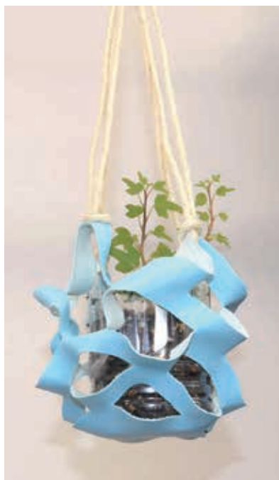
▲完成したプランターカバー

参加された方は「つりひもをまとめて結ぶところが難しかったが教え合いながらできた。夏らしく観葉植物を入れて飾りたい」と話されていました。