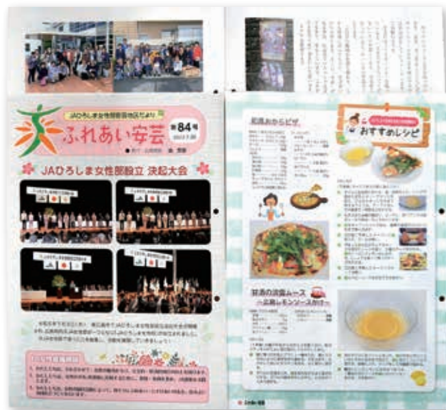
▲女性部活動を紹介する広報誌「ふれあい安芸」

JA女性部は7月20日、女性部広報誌「ふれあい安芸第84号」を発行しました。 広報誌には、7月3日に設立したJAひろしま女性部設立決起大会の様子や女性部員が考案したレシピの掲載、各支部からの活動紹介など掲載しています。 女性部員の方からは「他の支部の活動が参考になる」と好評です。 広報誌は、女性部員みなさんに配るほか、支店に設置しています。みなさまぜひご覧ください。