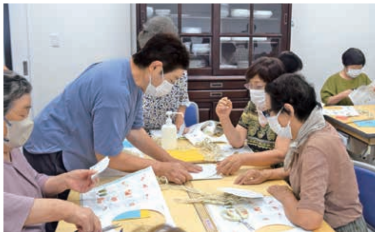
▲教え合いながら完成しました