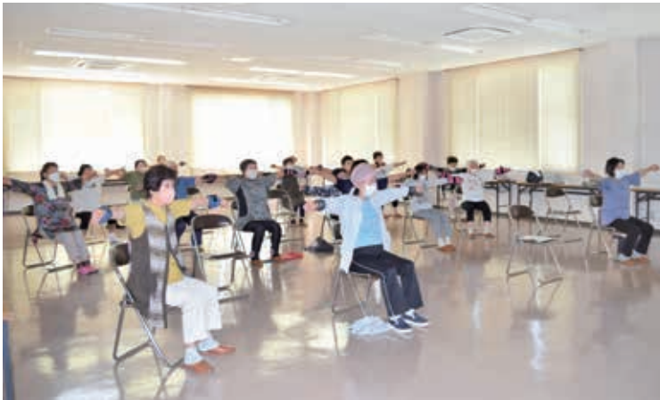
▲総会後は体操を行ないました

同クラブは、住み慣れた地域で誰もが安心して心豊かに暮らし、地域の活性化につなげることをめざして、毎週金曜日に健康寿命を延ばすために体力をつける体操など活動を行なっています。